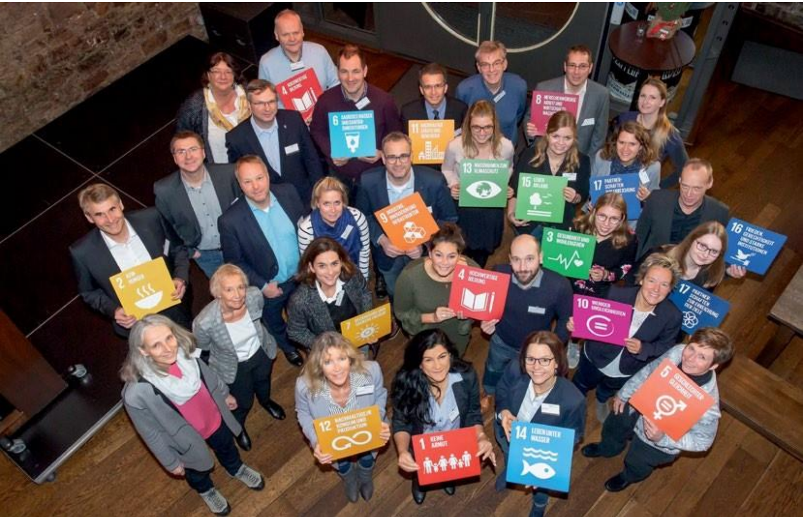
Das erste Vernetzungstreffen mit den Kommunen in Osnabrück