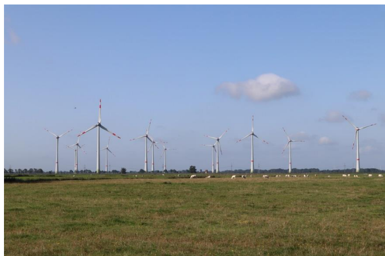
Nachhaltige Energieerzeugung in Brake (Unterweser)

Extern und interkommunal ist die Arbeit in der Steuerungsgruppe Fairtrade Region Unterweser verankert. Diese Gruppe setzt sich aus je 2 Vertreterinnen und Vertretern der Kommunen - Kommunalverwaltung und der Zivilgesellschaft - zusammen. In der Steuerungsgruppe Unterweser wird die gemeinsame Planung von Veranstaltungen besprochen. Für Ziele wie z.B. faire Kitas werden die dafür notwendigen Rahmenbedingungen (z. B. Fortbildungen) erarbeitet. Die Stadt Brake (Unterweser) nimmt derzeit die Geschäftsführung für diese Steuerungsgruppe wahr.