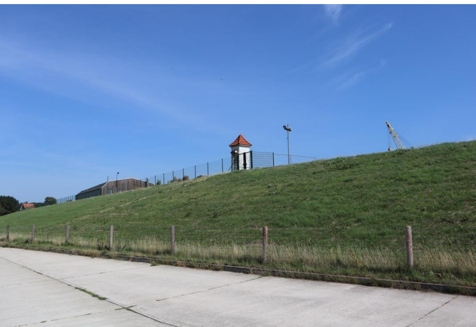
Nachhaltiger Küstenschutz in Brake (Unterweser)